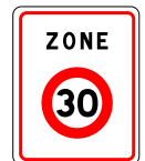
Zone où la vitesse est limitée à 30 km/h