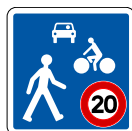
Zone de rencontre limitée à 20 km/h