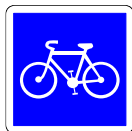
Piste cyclable conseillée et réservée aux 2 roues