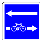
Double sens cyclable