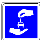
Station pour véhicules en autopartage