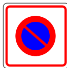
Zone de stationnement interdit